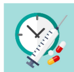
Uso Racional de Medicamento

O Paciente deve ser orientação pelo farmacêutico sobre seu medicamento, conferir o nome do paciente, nome do medicamento, a dosagem, forma de administração, quantidade e tempo do tratamento. Seguindo a prescrição médica.