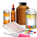
Acesso ao Medicamento

O paciente deve ser orientado em como ter acesso ao medicamento. Receber atendimento de dispensação do medicamento, renovação do tratamento e ajuste de dose.