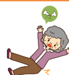
Risco de Quedas e Acidentes

Se o paciente sentir qualquer efeito indesejável que tenha começado com a tomada da medicação, é importante procurar o farmacêutico ou seu médico.